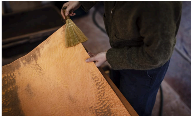
Det finns något taktilt över verken som lockar till beröring.

"Hennes poesi betyder oerhört mycket för mig. Framförallt hennes diktverk "det" och "alfabet" i vilka universum målas upp från det lilla till det stora med hjälp av matematiska system som skapar en sorts rytm och struktur som inrymmer allt från skapande till förstörelse. Det är magnifikt."